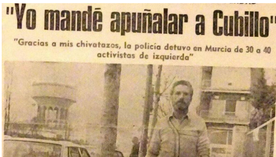
Portada de La Verdad del 13 de marzo de 1982 con la entrevista a Espinosa

ERENA CALVO e IVÁN ALEJANDRO HERNÁNDEZ | 26 SEPTIEMBRE 2022