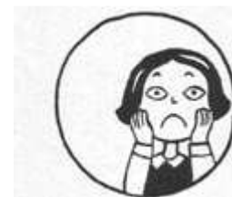
Así se autorretrata Marjane de niña en Persépolis

En este punto acaba la historia del primero de los cuatro álbumes que componen Persépolis . El segundo ocupa el periodo de 1980 a 1984 y tiene como trasfondo la guerra entre Irán e Irak a mitad de los ochenta y el inicio de su adolescencia, donde conoceremos, por ejemplo, de su afición a grupos musicales prohibidos por el régimen islámico, y algunos de los problemas en que se mete ya de bien jovencita por su carácter rebelde. El tercer álbum se centra en las múltiples penurias y peripecias vitales que vivirá la autora en Austria entre 1984 y 1989, donde es enviada a vivir por sus padres para protegerla tanto de los bombardeos como de los problemas legales en los que podría acabar de continuar con su conducta, que no siempre se adecuaba a las costumbres