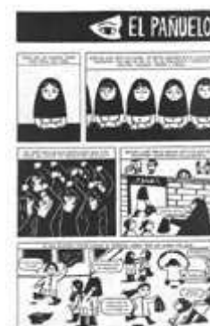
Página del cómic [haz clic para ampliar] en la que se relata el momento en que en el colegio de Marjane obligan a las niñas a cubrirse con un pañuelo y la reacción de éstas.