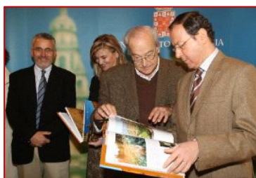
Presentación de "Murcia, sensual y barroca"