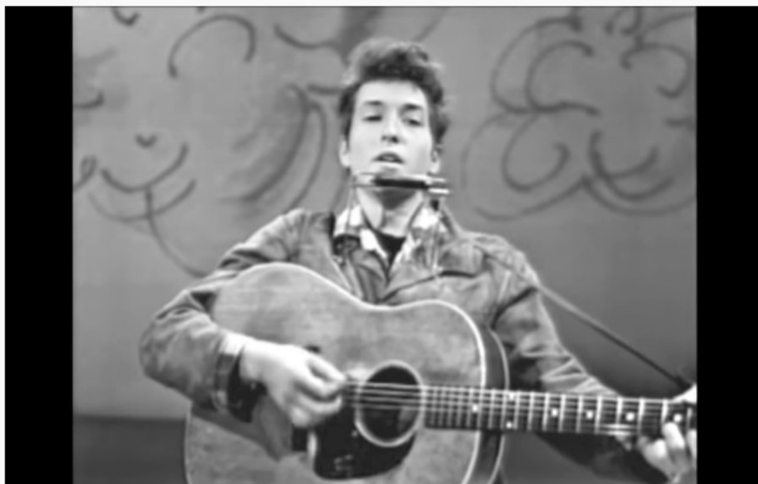
Blowing In The Wind (Live On TV, March 1963)

https://www.youtube.com/watch?v=vWwgrijlMXA